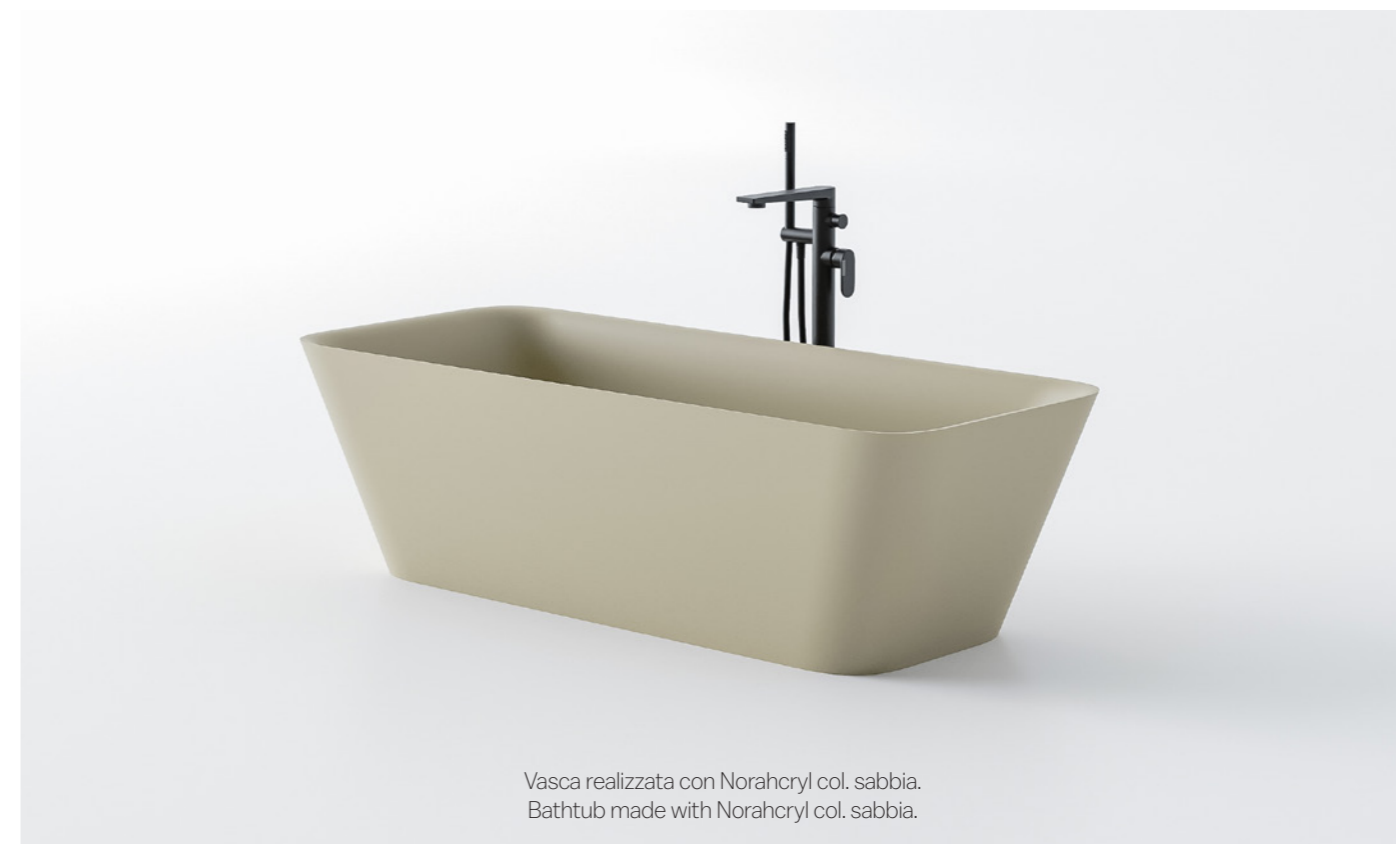
Vasca realizzata con Norahcryl col. sabbia. Bathtub made with Norahcryl col. sabbia.